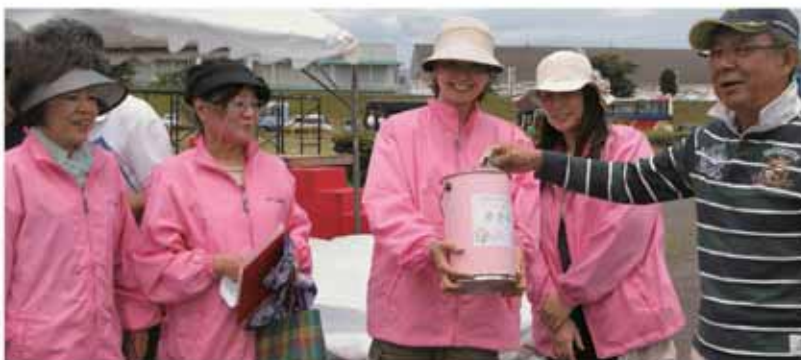
ふれあい募金及び東日本大震災復興支援の募金活動をしました。