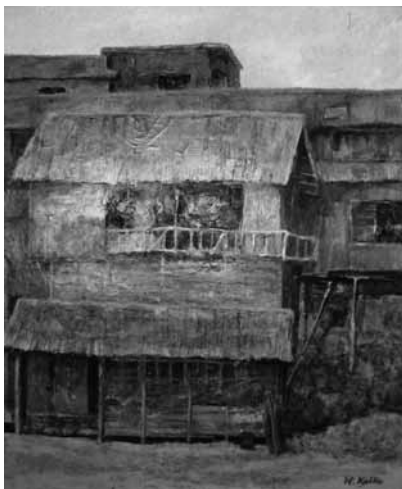
題名「ダム・サイト」F80号

ダム建設地に残された建物。かなり放置されたままで、いかにも崩れそうであったが、工事最盛期にはさぞ賑やかであったろうに。今でも感じる人のざわめき、生活の痕跡、昔の遺跡に感じるものとなにか通じるといってオーバーかな？