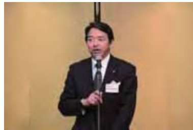
参議院議員 榛葉賀津也様