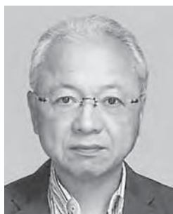
ほ なみ きよ かず 穂 波 巨 一

技術職からの転身です。新たな挑戦として登録しま した。よろしくお願ひいたします。