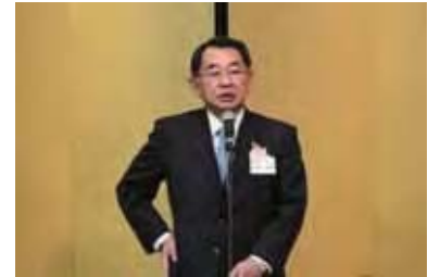
衆議院議員 塩谷立様