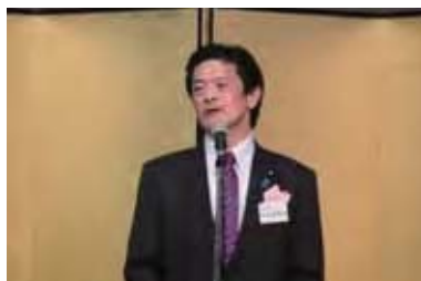
参議院議員 岩井茂樹様