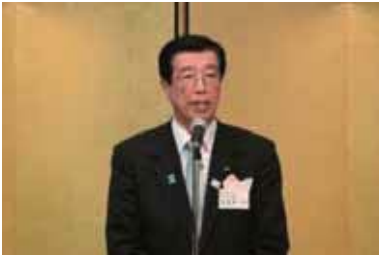
静岡県議会議長 渥美泰一様