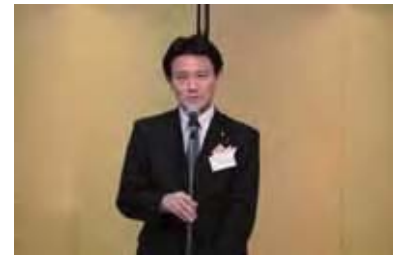
衆議院議員 井林辰憲様