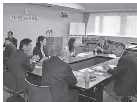
グループミーティングの様子