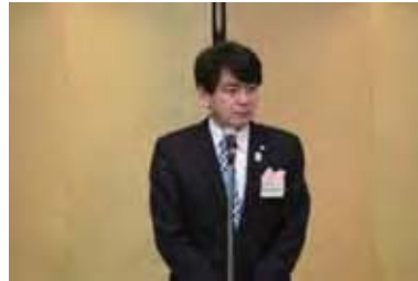
浜松市議会議長 飯田末夫様