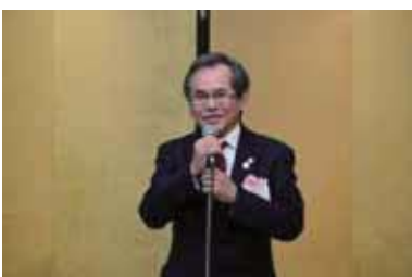
日本行政書士会連合会副会長野田昌利様