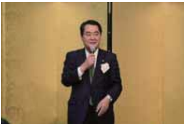
参議院議員 牧野京夫様