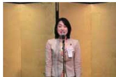
参議院議員 平山佐知子様