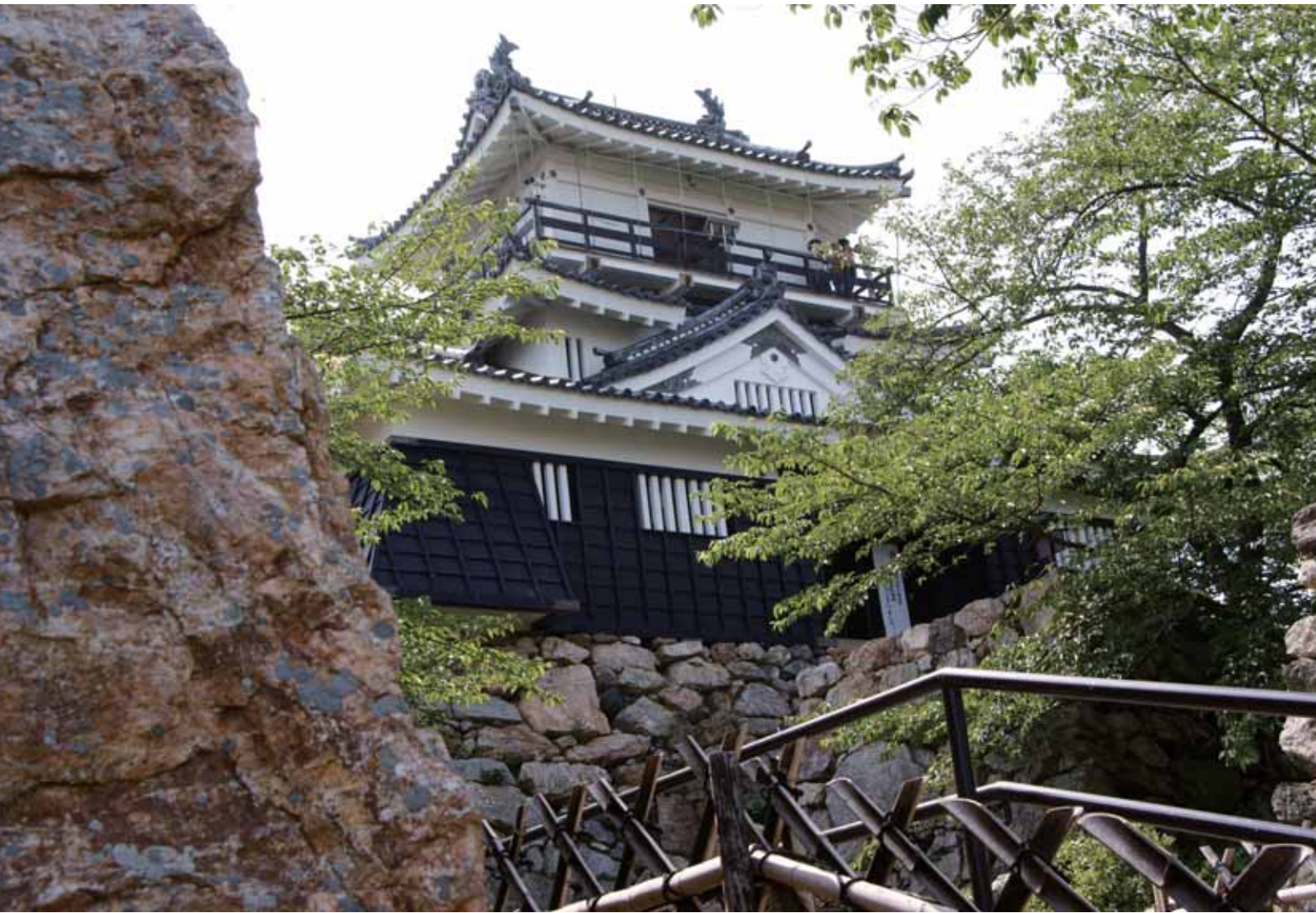
出世城（総会会場の隣の浜松城。代々の城主が幕府の重役に出世した。）