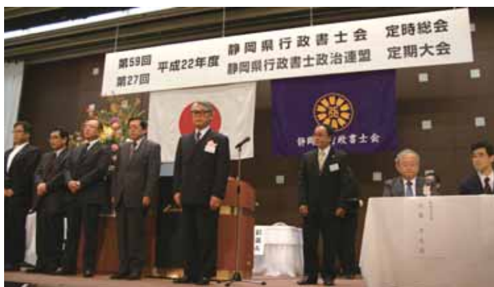
静岡県行政書士会会長表彰を受賞された皆様