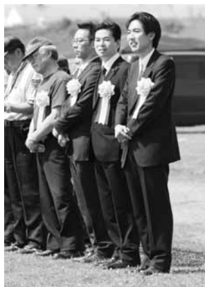
ご来賓のみなさま