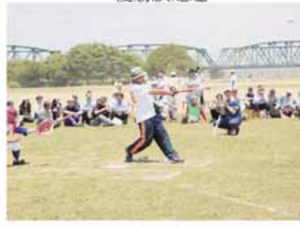
ナイスバッティング