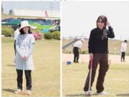
グラウンドゴルフ 女性プレーヤーたち