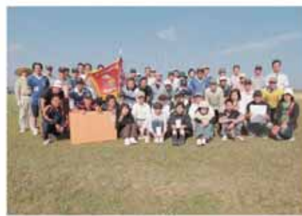
ソフトボール優勝チーム