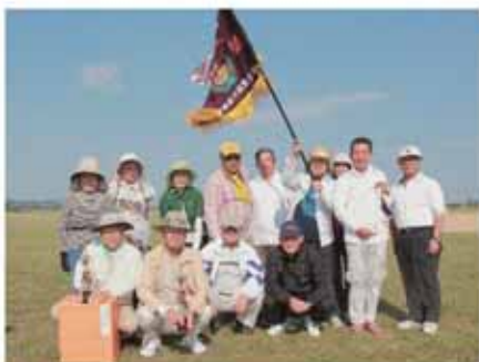
グラウンドゴルフ優勝チーム