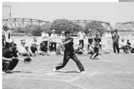
狙うはホームラン!!