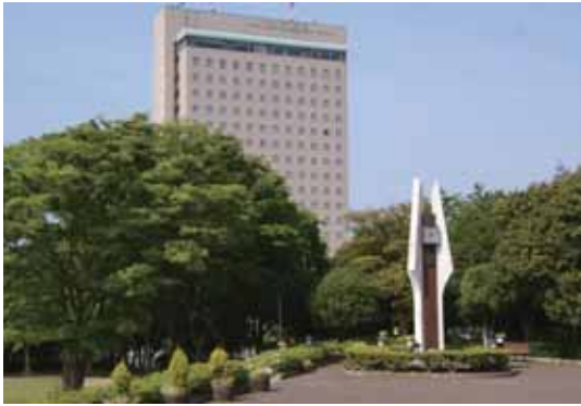
会場 ホテルコンコルド浜松